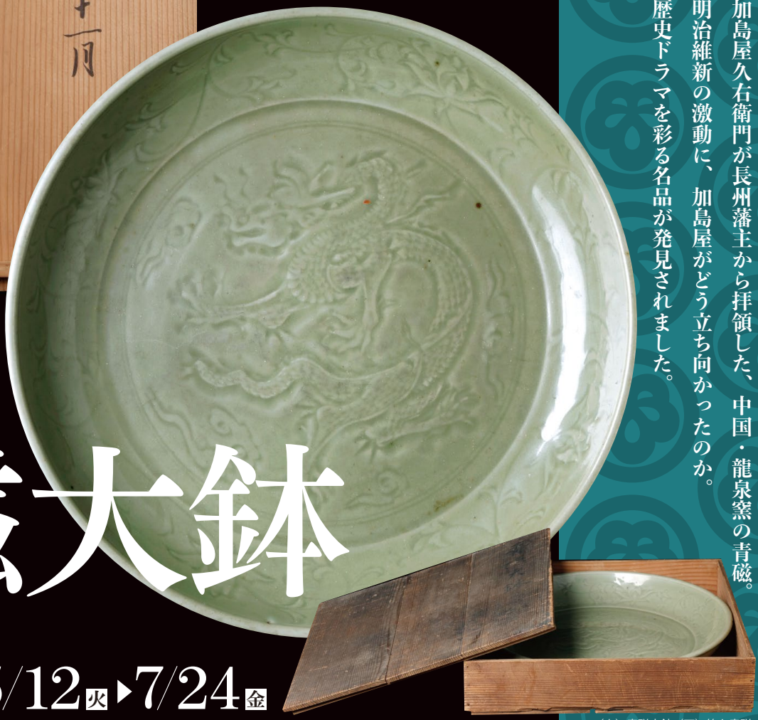
(上) 青磁大鉢 (下) 箱と青磁