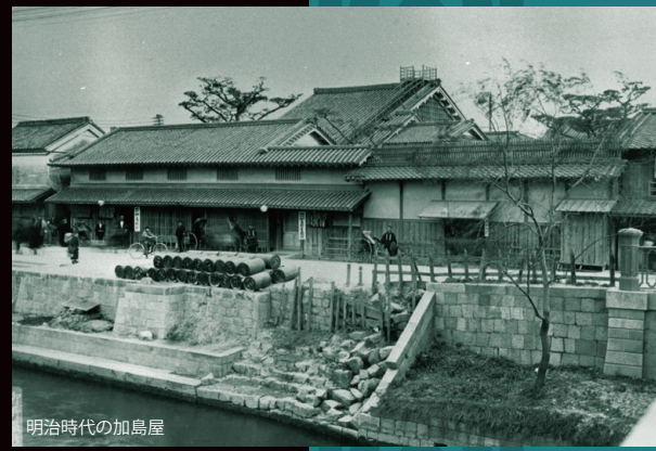
明治時代の加島屋

明治元年戊辰十一月 長州御政府方 山縣孫八原白根多由良 御上段御銀談付被為 下迄候旨御達 正饒并領之