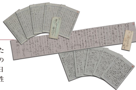
浅子が成瀬仁蔵に宛てた直筆の書簡【複製】

2015年に放送された連続テレビ小説「あさが来た」(NHK)の主人公モデルとなった彼女の生涯と活躍、人となりなどを詳しくご紹介しています。