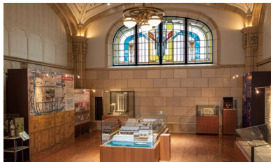
特別展示会場 大阪本社メモリアルホール